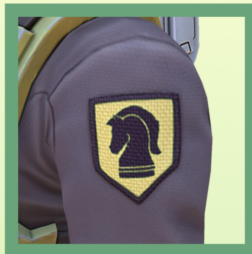
Detalhe do retalho